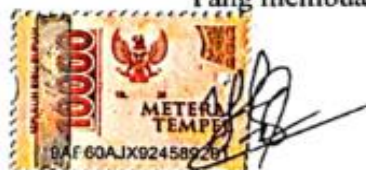
Yuzi Saputra NPM : 1811100

Baturaja, 23 Agustus 2022 Yang membuat pernyataan,