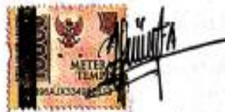
Yunita Anggraeni NPM. 1921019