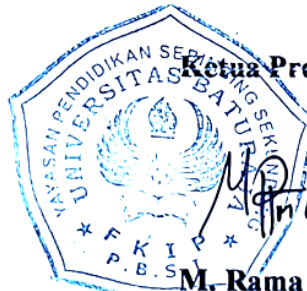
Ketua Program Studi,