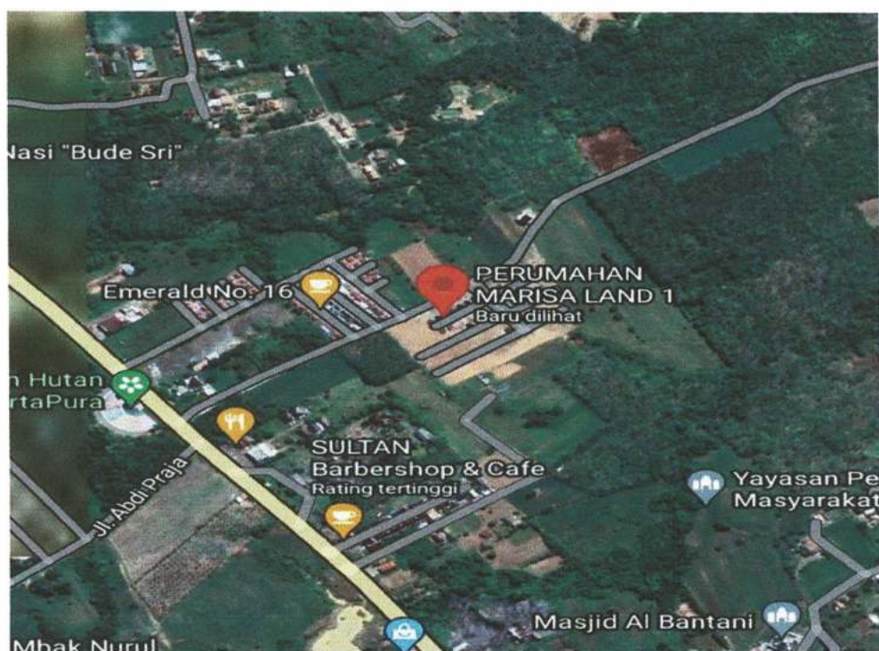
Gambar 3.2 Lokasi Penelitian

Lokasi Pembuatan manajemen konstruksi pada pembangunan rumah type 36 pada proyek Pembangunan Perumahan Marisa Group Berada Di Jl Lintas Sumatera Desa Suko Mukyo Kecamatan Martapura Kab OKU Timur.