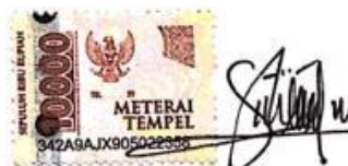
Selvi Pransiska NPM: 1911106

Baturaja, 03 Juni 2023 Yang membuat pernyataan,