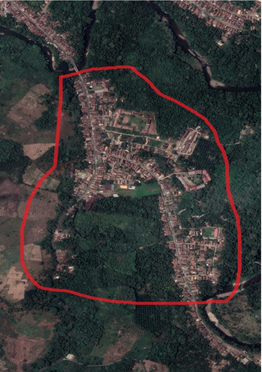
Gambar 3.2 Denah Lokasi Penelitian