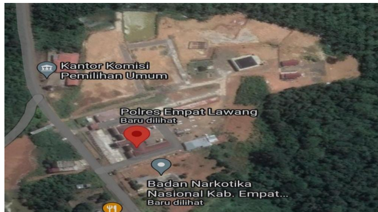
Gambar 3.3 Peta lokasi RUMDIN POLRES EMPAT LAWANG

Penelitian ini akan dilaksanakan di JL.Terusan lama Kec.Tebing tinggi Kab.Empat lawang, Lokasi penelitian dapat dilihat pada gambar 3.3