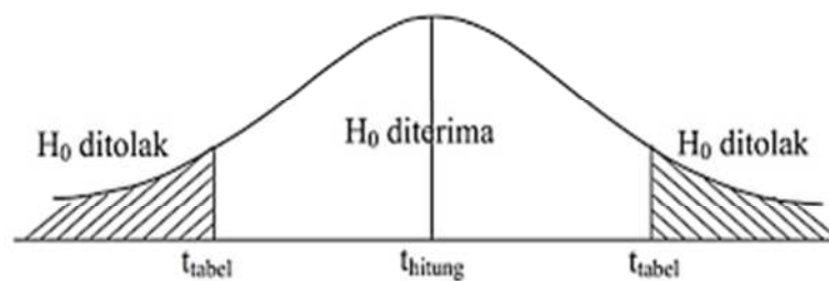
Gambar 3.1 Kurva Pengujian Hipotesis Parsial (Uji T)

h. Kesimpulan apakah H_0 diterima atau ditolak