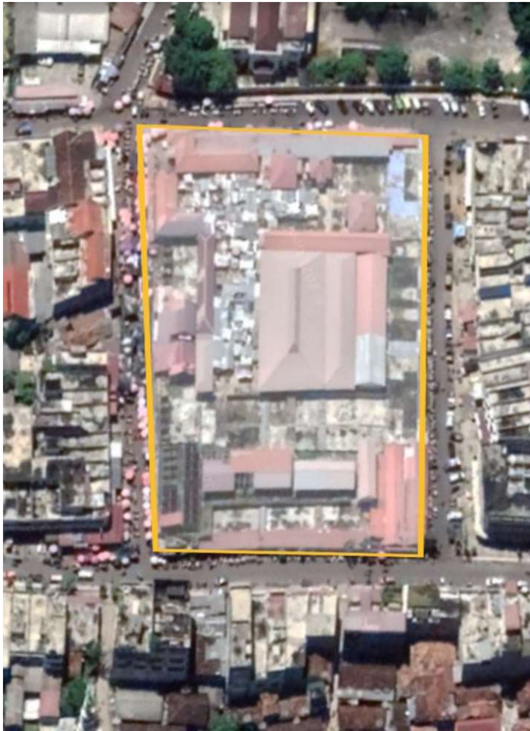
Gambar 3.2 : Lokasi Penelitian