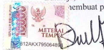
Della Utari NPM. 2052017