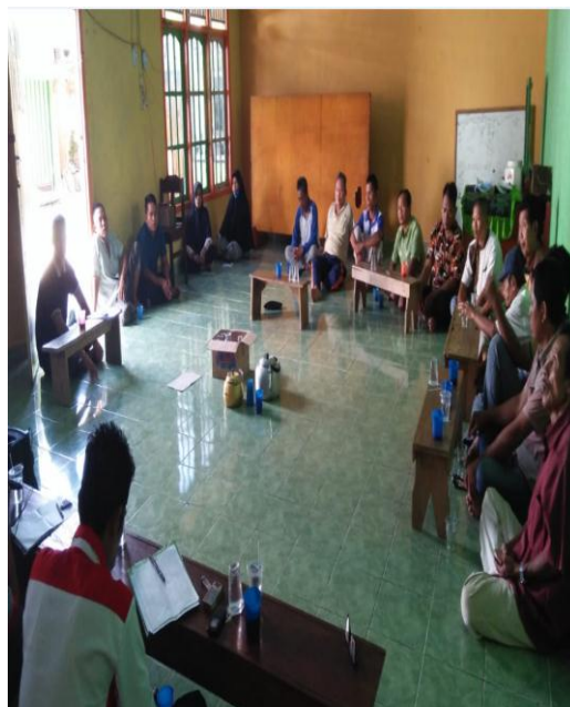
Gambar 5. Pelaksanaan Musyawarah Dusun Dalam Proses Penggalian dan Penyaluran Aspirasi Rakyat