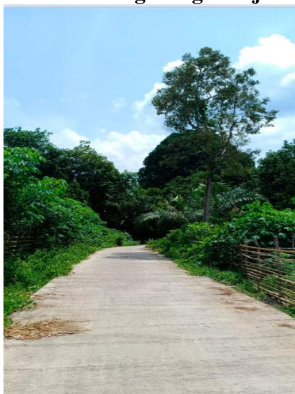
Gambar 3. Realisasi Aspirasi Rakyat Berupa Jalan Cor Beton