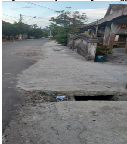
Gambar 2. Realisasi Aspirasi Rakyat Berupa Pembangunan Siring Utama Untuk Mengurangi Banjir