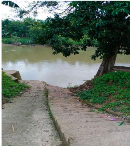
Gambar 1. Realisasi Aspirasi Rakyat Berupa Tangga Pemandian Umum