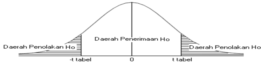
Gambar 3.1 Uji-t Dua Pihak