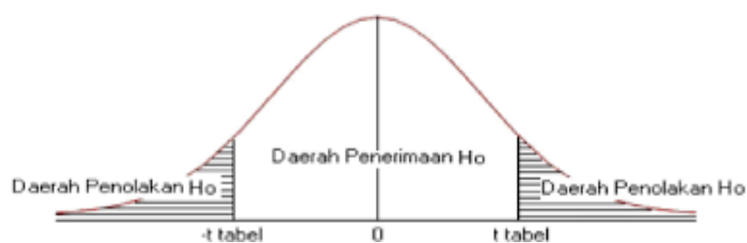
Gambar 3.2. Kurva Distribusi Uji t

f. Menggambarkan Area Keputusan Pengujian: