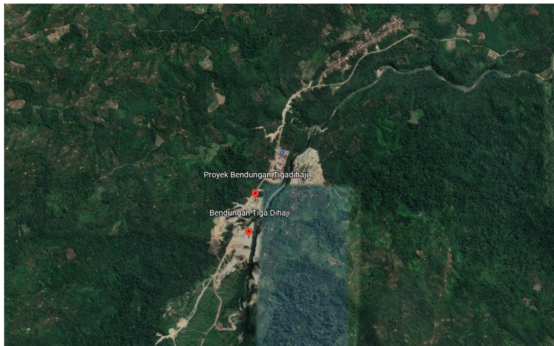
Gambar 3.2 Lokasi Penelitian

Waktu Penelitian dilaksanakan dari bulan Februari 2022, Jadwal penelitian dapat dilihat pada tabel 3.4