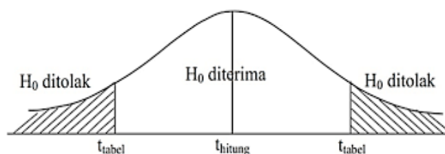
Gambar 3.1 Kurva uji t

b. Jika nilai t_{hitung} < t_{tabel} maka hipotesis di terima, artinya variabel tersebut tidak berpengaruh terhadap variabel dependen.