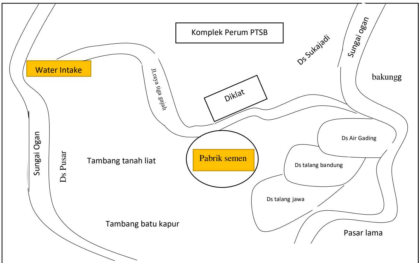
Gambar 3.1. Peta Lokasi Pabrik Baturaja PT Semen Baturaja ( Persero )

Lokasi penelitian ini adalah Unit Pengolahan Air ( Water Treatment ) Pabrik Baturaja PT Semen Baturaja ( Persero ), Jalan Raya Tiga Gajah Kelurahan Sukajadi Kecamatan Baturaja Timur Kabupaten Ogan Komering Ulu Propinsi Sumatera Selatan Kode Pos 32117 Telepon +62 735 320344. Adapun lokasi penelitian dapat dilihat pada gambar berikut ini :