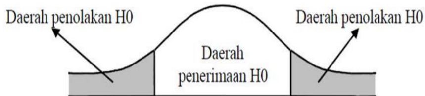
Gambar 3 Kurva Distribusi Uji t

H_a : \beta \neq 0 Artinya tingkat pengangguran terbuka dan penyerapan tenaga kerja berpengaruh signifikan terhadap pendapatan asli daerah (PAD) di Kabupaten Kota di Provinsi Sumatera Selatan