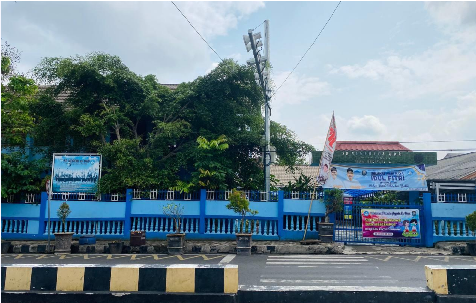
SD N 03 OKU