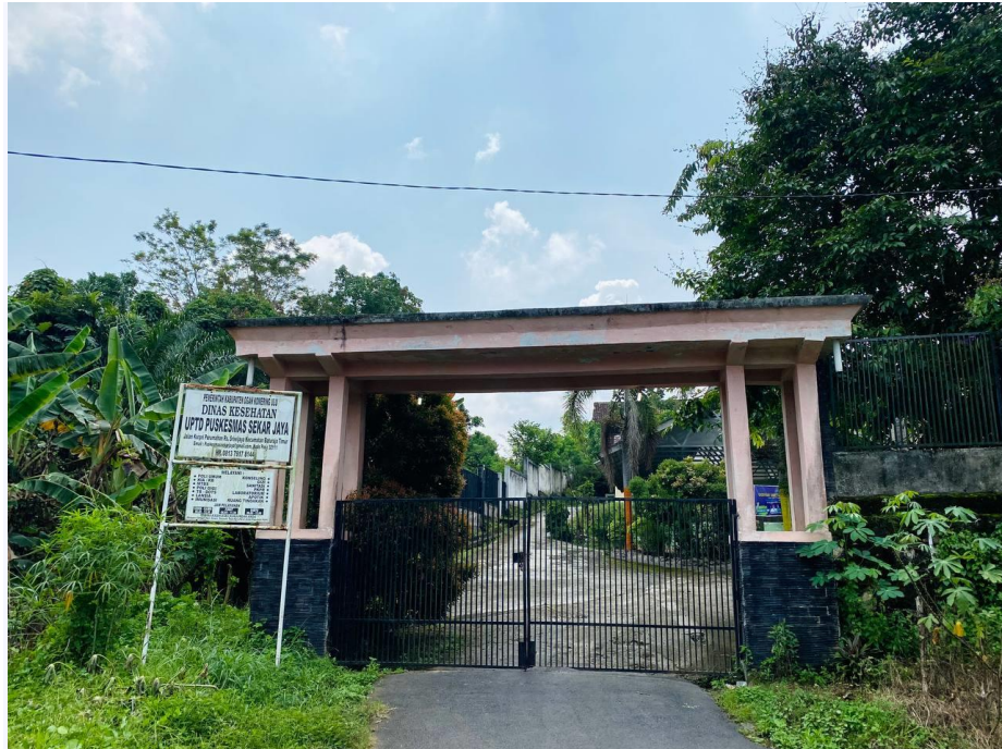
UPTD PUSKESMAS SEKAR JAYA