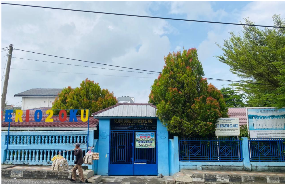
SD N 02 OKU