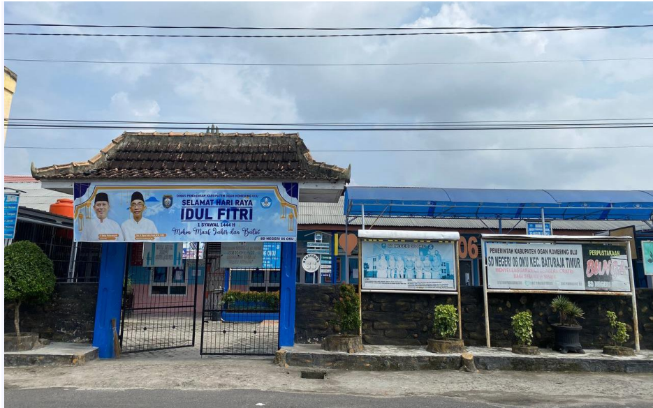
SD N 06 OKU