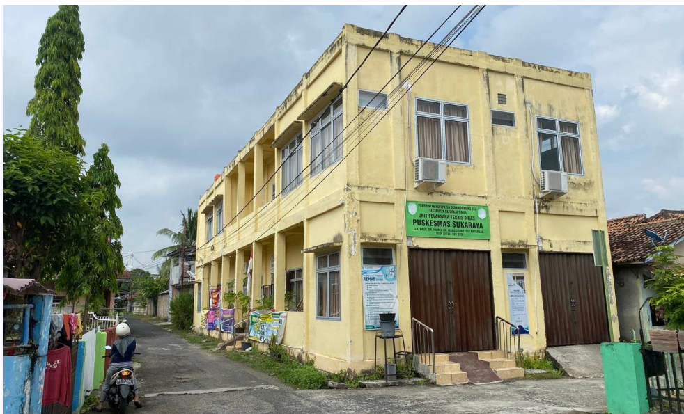
UPTD PUSKESMAS SUKARAYA