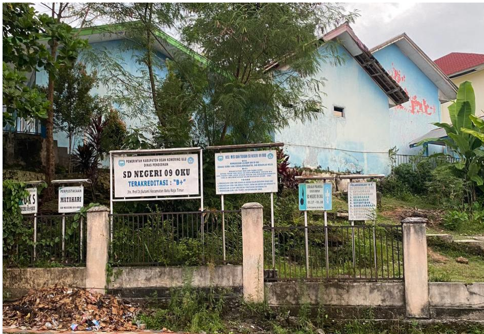
SD N 09 OKU