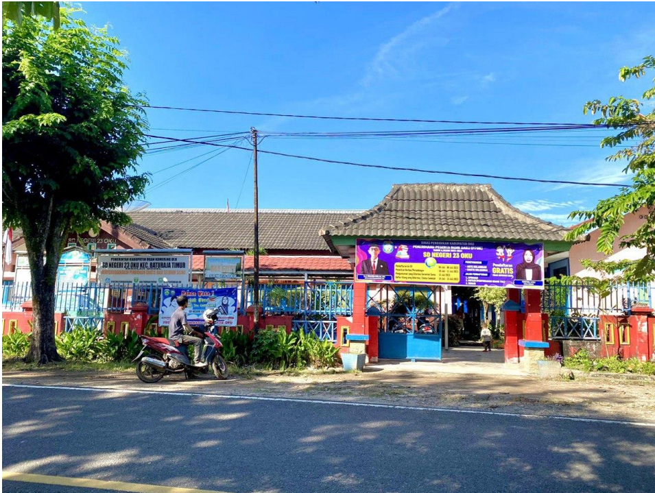
SD N 23 OKU