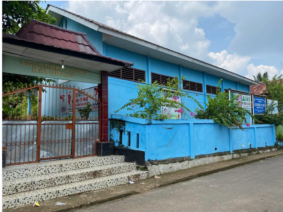
SD N 43 OKU