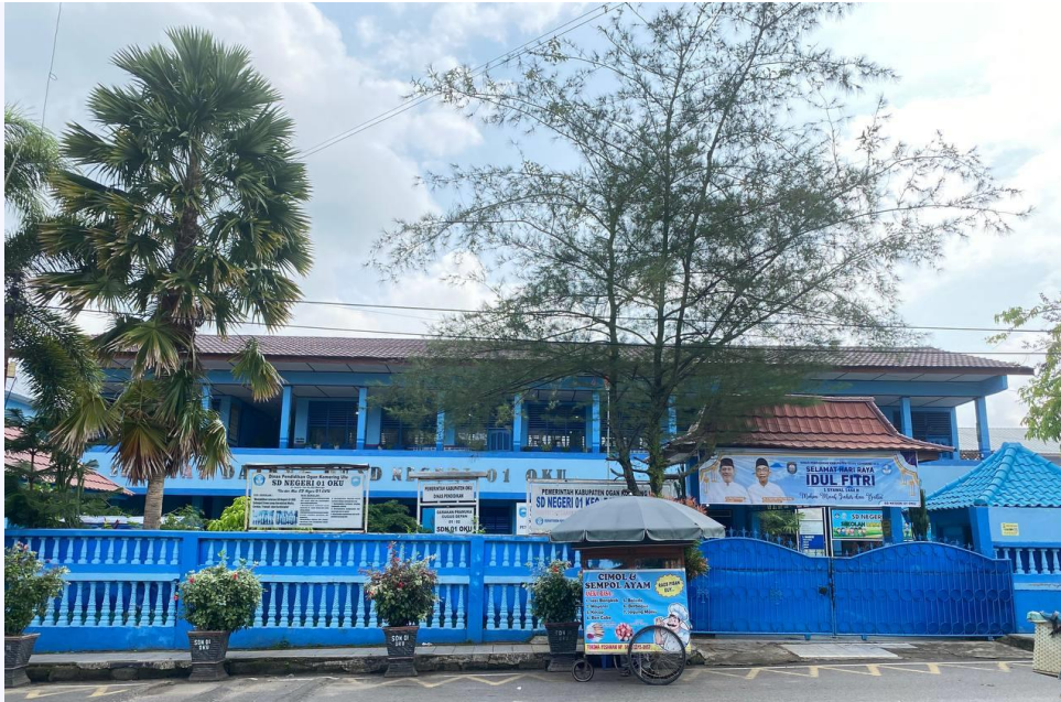
SD N 01 OKU