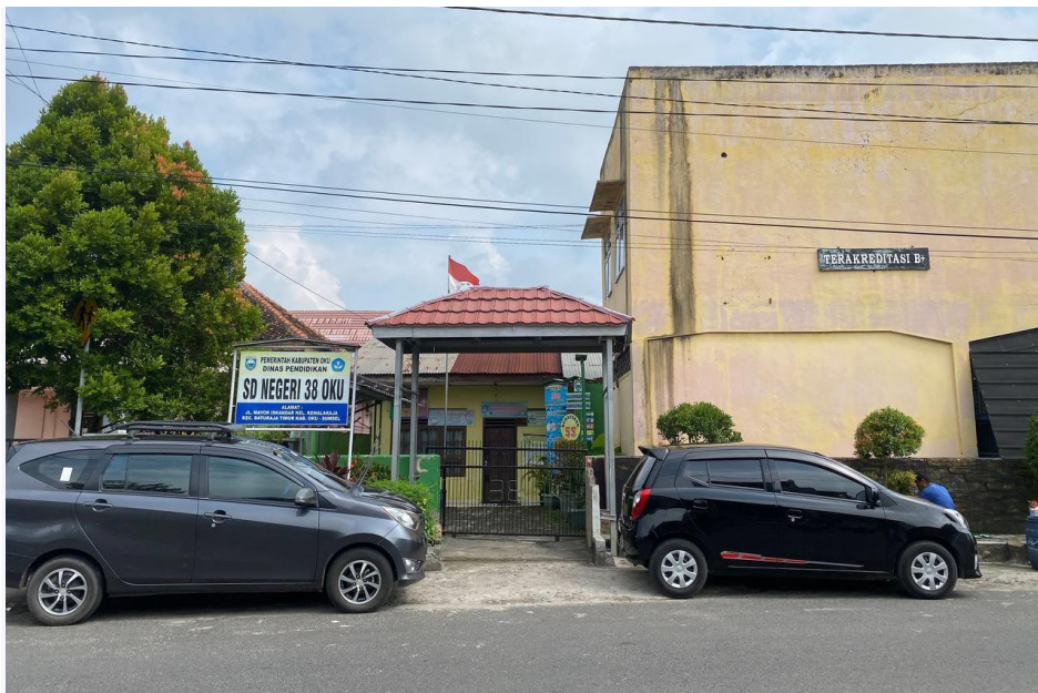
SD N 38 OKU