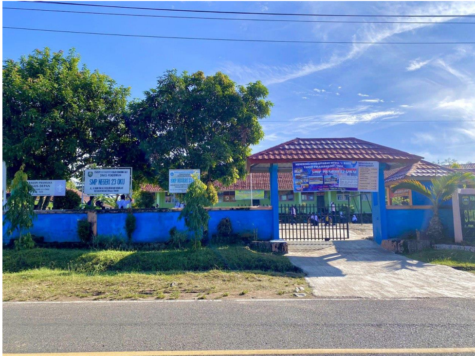
SMP N 23 OKU