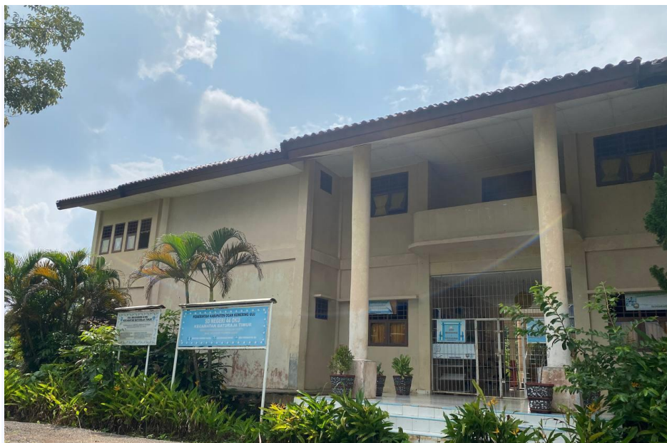
SD N 44 OKU