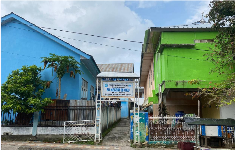
SD N 08 OKU