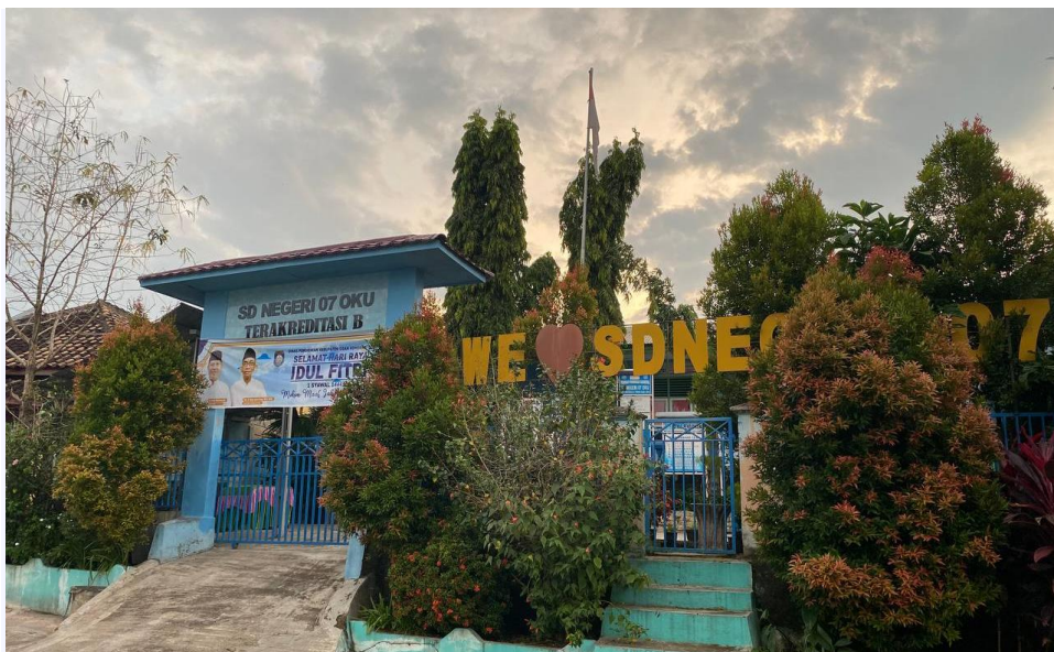
SD N 07 OKU