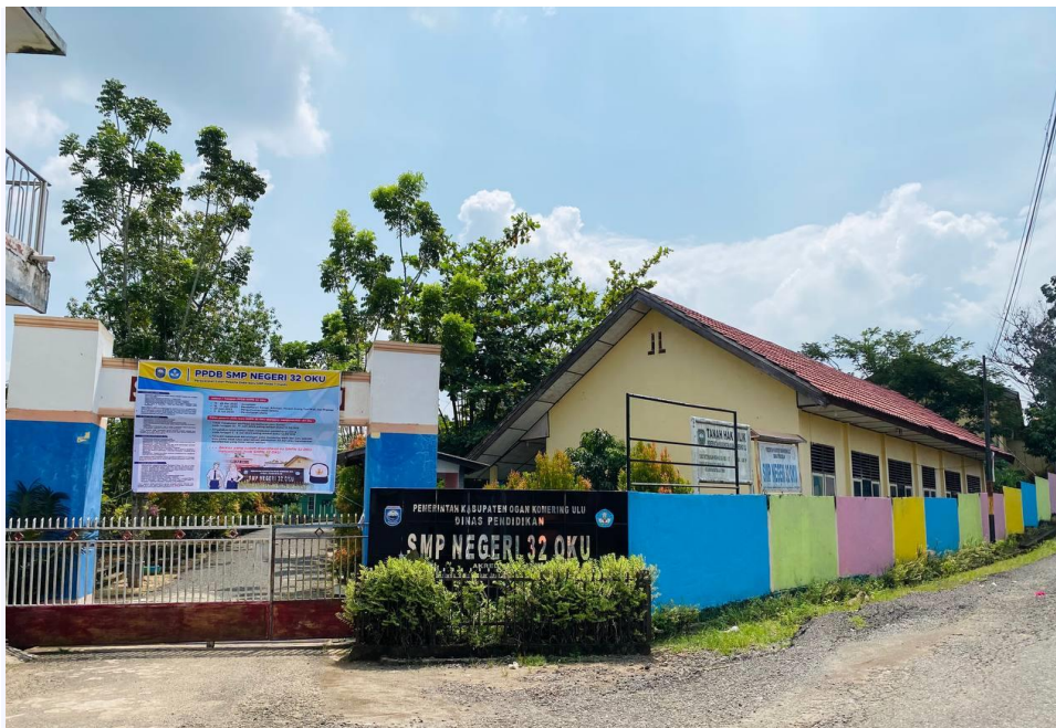
SMP N 32 OKU