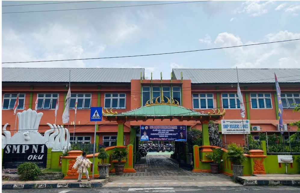
SMP N 01 OKU