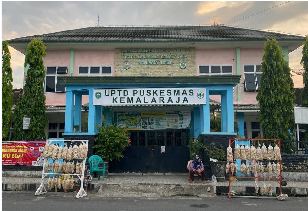
UPTD PUSKESMAS KEMALARAJA