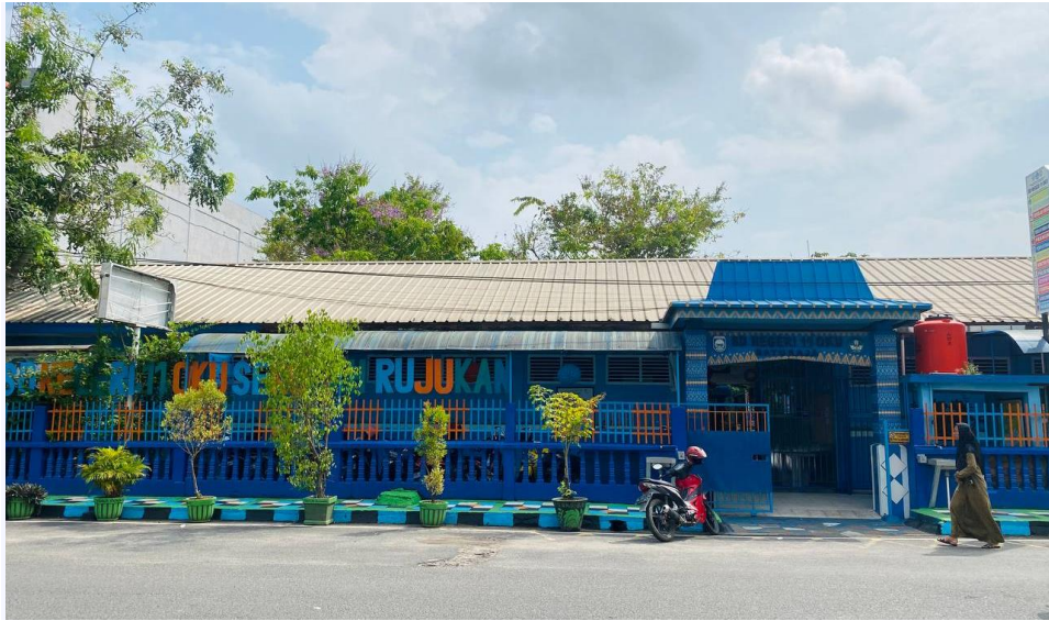
SD N 11 OKU