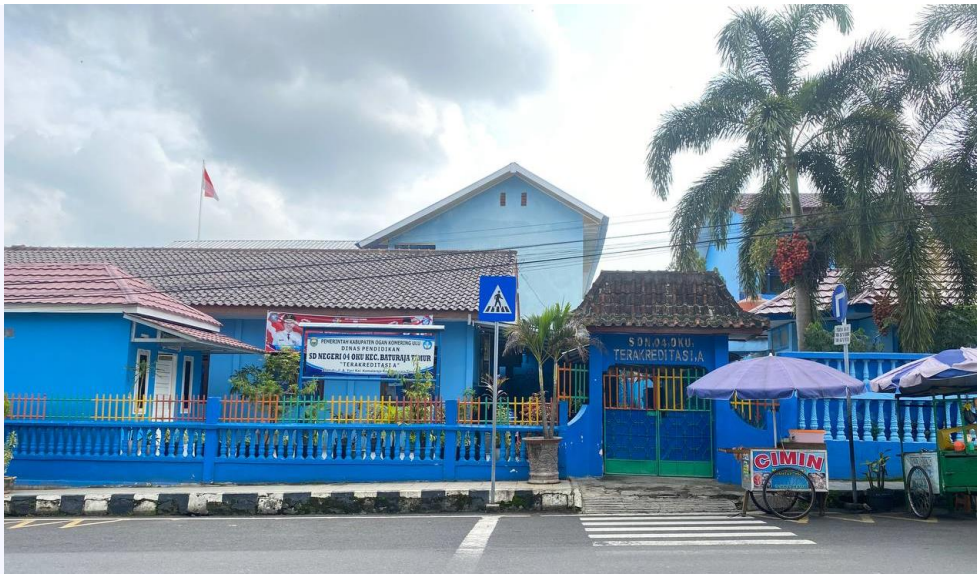
SD N 04 OKU