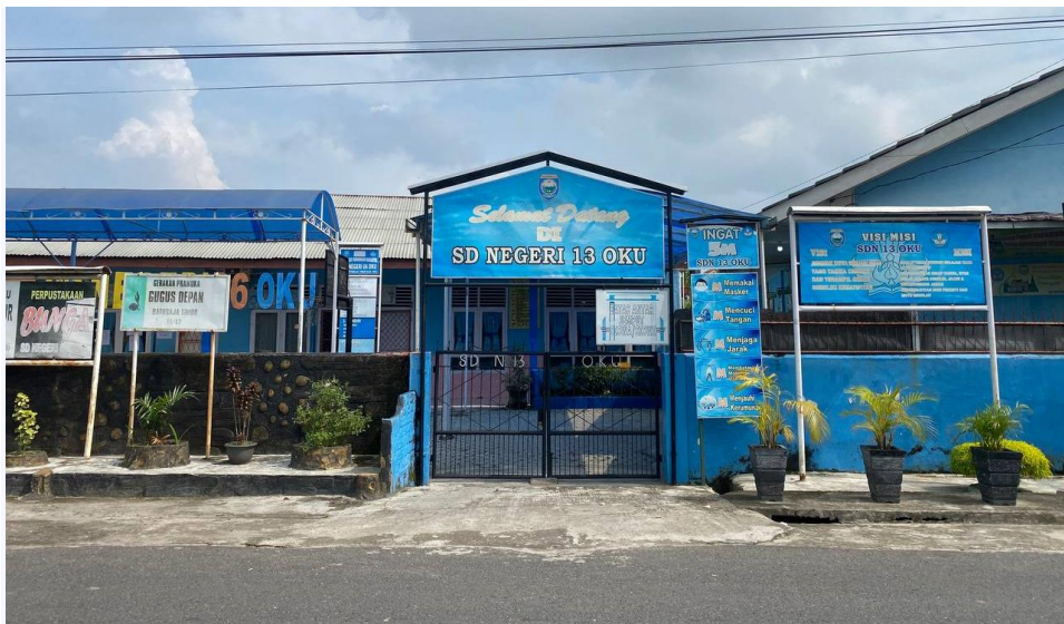
SD N 13 OKU