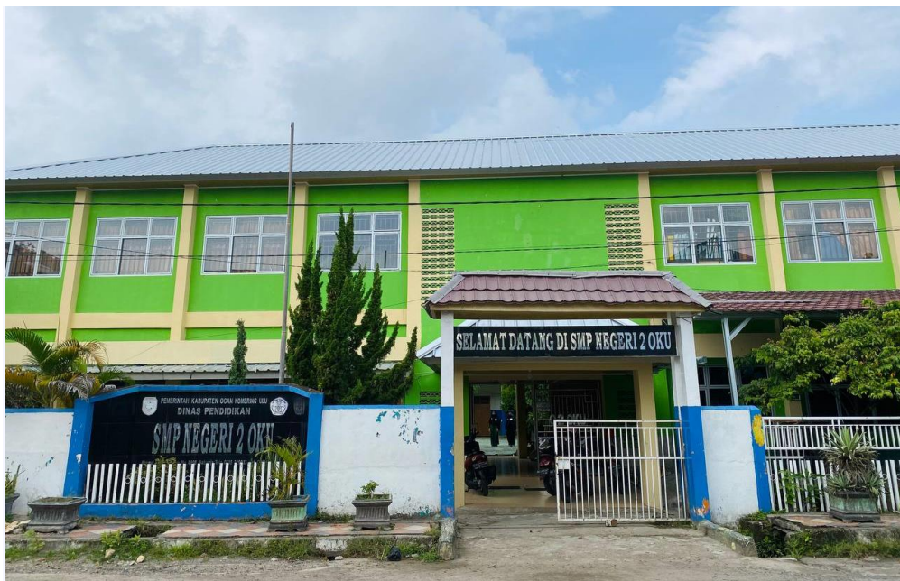
SMP N 02 OKU