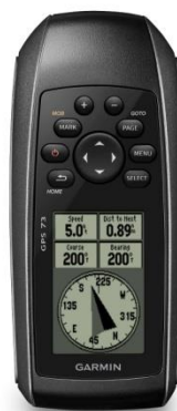
Gambar 2.1 GPS (Global Positioning System) Handheld

GPS merupakan salah satu metode dalam geodesi satelit yang digunakan untuk penentuan posisi di permukaan bumi secara 3D dimana penentuannya. Menggunakan teknik trilaterasi dengan menggunakan jarak dari beberapa lokasi yang diketahui untuk menentukan koordinat lokasi yang tidak diketahui. Semakin banyak satelit yang diperoleh maka akurasi posisi kita akan semakin tinggi. Untuk mendapatkan sinyal tersebut, perangkat GPS harus berada di ruang terbuka. Melalui GPS kita dapat mengetahui keberadaan suatu objek dimana pun objek itu berada di seluruh muka bumi baik di darat, laut maupun udara.