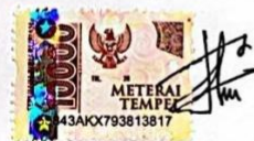
Tika Imelda NPM: 2011147

Baturaja, Januari 2024 Yang membuat pernyataan,