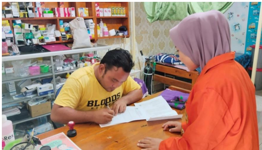
Dokumentasi Pemberian Dan Penerimaan Surat Izin