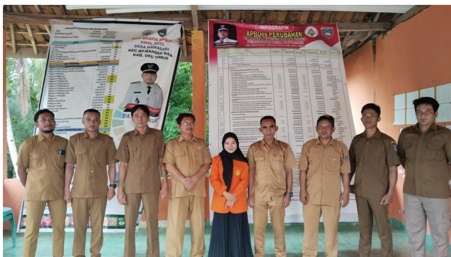
Foto Bersama Dengan Beberapa Perangkat Desa