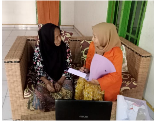
Dokumentasi Pengambilan Data