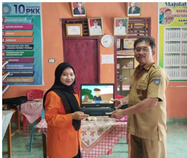
Dokumentasi Penyerahan Produk