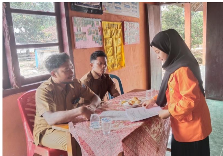
Dokumentasi Penyebaran Kuesioner