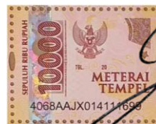
JUMLI SATRA NPM: 2011025

Baturaja, 04 Januari 2024 Yang membuat pernyataan,