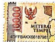
Desya Arum Mutiara NPM: 2011092

Baturaja, Desember 2023 Yang membuat pernyataan,