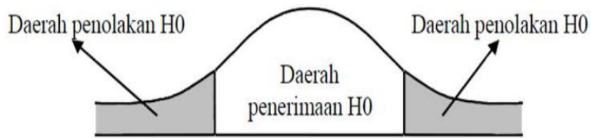
Gambar 3.2 Kurva Distribusi Uji t