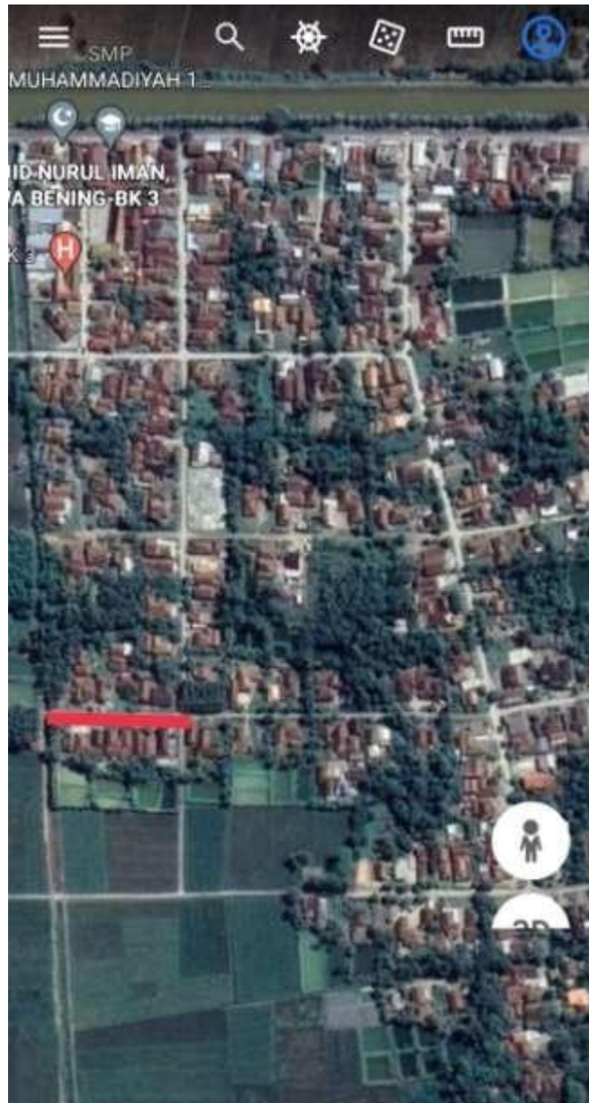
Gambar.3.2. Peta Lokasi Penelitian