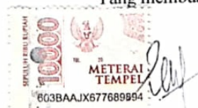
Bella Juliani NPM: 1811030