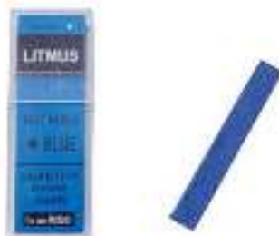
Gambar 2. 5 Kertas Lakmus Biru.

Digunakan untuk mendeteksi sifat asam. Jika kertas lakmus biru berubah menjadi merah, maka larutan yang diuji bersifat asam.