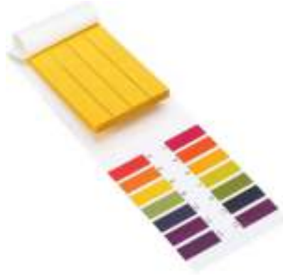
Gambar 2. 6 Kertas Lakmus Universal

Digunakan untuk mendeteksi sifat asam. Jika kertas lakmus biru berubah menjadi merah, maka larutan yang diuji bersifat asam.