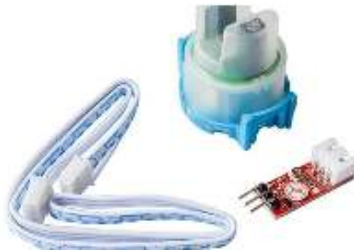
Gambar 2. 2 Sensor turbidity

Sensor turbidity , atau sensor kekeruhan, adalah perangkat yang digunakan untuk mengukur tingkat kejernihan atau kekeruhan suatu cairan, terutama air. Prinsip kerja sensor ini didasarkan pada interaksi antara cahaya dan partikel-partikel yang terdapat dalam air.