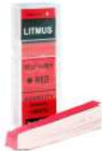
Gambar 2. 4 Kertas Lakmus Merah

Digunakan untuk mendeteksi sifat basa. Jika kertas lakmus merah berubah menjadi biru saat dicelupkan ke dalam larutan, berarti larutan tersebut bersifat basa.