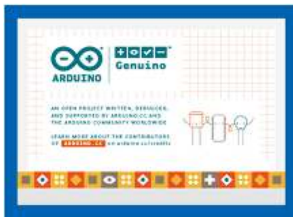
Gambar 2. 3 Software Arduino IDE

Arduino IDE ( Integrated Development Environment ) adalah sebuah perangkat lunak ( software ) yang dirancang khusus sebagai lingkungan pemrograman untuk mengembangkan dan mengunggah program ke berbagai papan pengembangan berbasis mikrokontroler, seperti Arduino Uno, Nano, Mega, serta papan lain seperti NodeMCU ESP8266 dan ESP32. Arduino IDE menjadi jembatan penting antara pengguna dan perangkat keras, karena memungkinkan kita menulis, mengedit, menyusun, dan mengunggah kode (sketch) langsung ke dalam board[7].