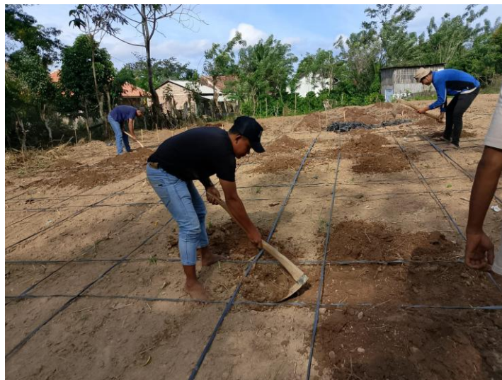
Gambar 2. Pembuatan Petakan