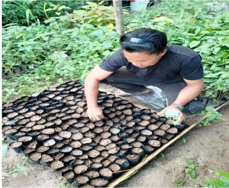
Gambar 3. Penyemaian