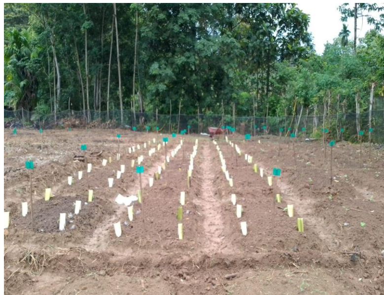
Gambar 6. Pindah Tanam Terong