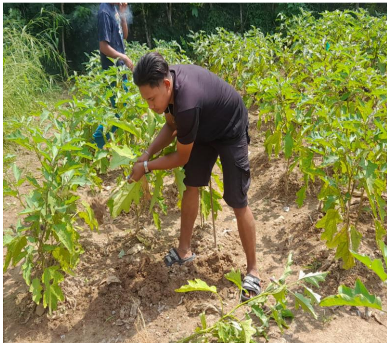
Gambar 8. Panen