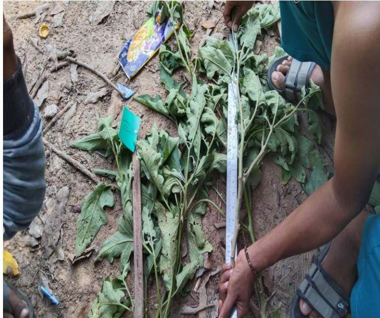
Gambar 9. Mengukur Tinggi Tanaman