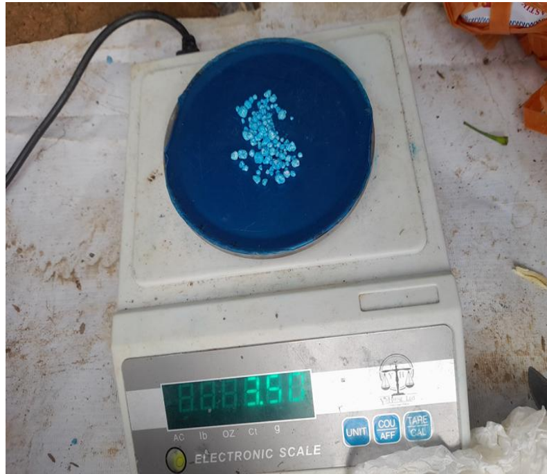
Gambar 5. Penimbangan Pupuk NPK