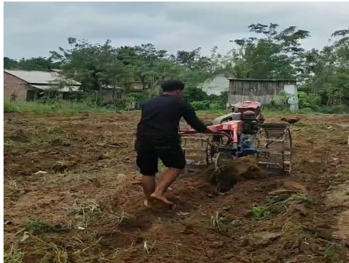
Gambar 1. Penyiapan Lahan