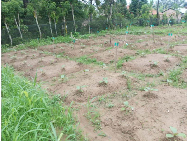
Gambar 7. Terong Umur 2 Minggu