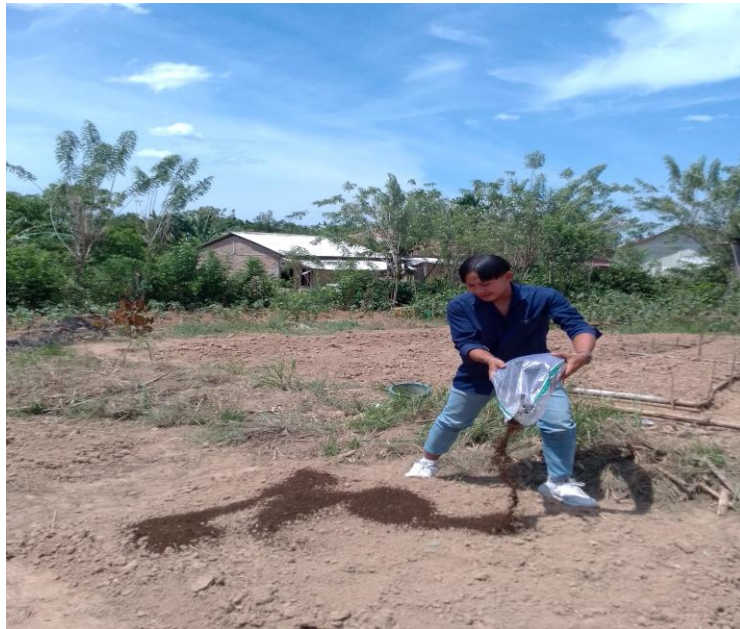
Gambar 4. Pemberian Pupuk Vermikompos