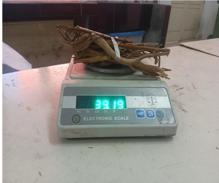
Gambar 11. Berat Kering Tajuk