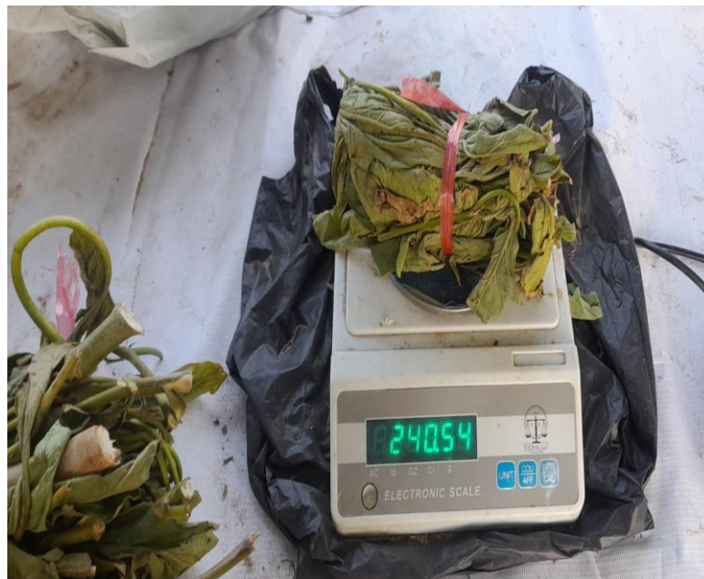
Gambar 10. Berat Basah Tajuk