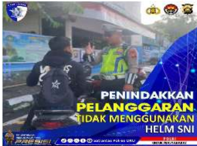
Gambar 1.1 Pelanggaran Lalu Lintas Tilang Manual

Electronic Traffic Law Enforcement (ETLE) adalah sistem penegakan hukum lalu lintas yang dilakukan secara otomatis dan digital menggunakan kamera pemantau (CCTV) dan sistem pengolahan data elektronik. Kamera ETLE dipasang di titik-titik tertentu untuk merekam pelanggaran lalu lintas, seperti menerobos lampu merah, tidak menggunakan helm, menggunakan ponsel saat berkendara, dan lainnya. Setelah pelanggaran terekam, data kendaraan akan diverifikasi oleh operator, dan surat konfirmasi pelanggaran akan dikirimkan ke alamat pemilik kendaraan. Proses konfirmasi dan pembayaran denda dilakukan secara online, tanpa perlu interaksi langsung dengan petugas. Sistem tilang elektronik juga memberikan kemudahan bagi pelanggar dalam membayar denda secara online tanpa harus pergi ke kantor polisi atau bank. 27