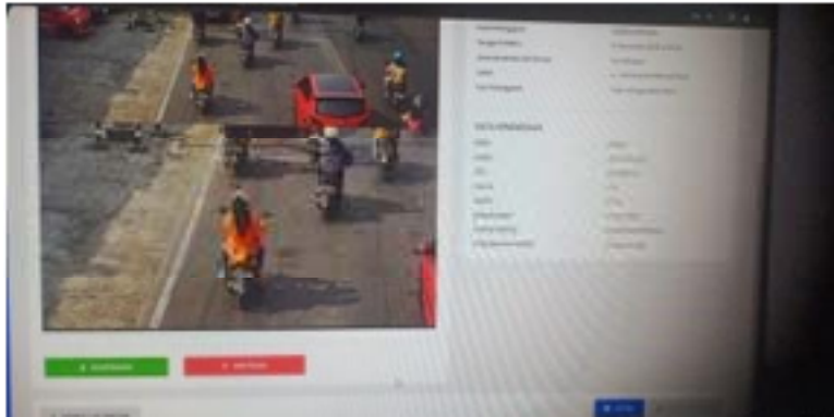
Gambar 1.2 Pelanggaran Lalu Lintas Electronic Traffic Law Enforcement (ETLE)

Sebelum adanya mekanisme Electronic Traffic Law Enforcement (ETLE), pengguna lalu lintas apabila melanggar aturan dikenakan sanksi yang biasa disebut tilang atau bukti pelanggaran. Mekanisme tilang ini berbeda dengan mekanisme Electronic Traffic Law Enforcement (ETLE). Sistem tilang, ketika pengguna lalu lintas terbukti melakukan kesalahan atau pelanggaran maka petugas kepolisian akan melakukan beberapa tindakan, mekanisme tilang untuk formulir berwarna merah adalah sebagai berikut: 28