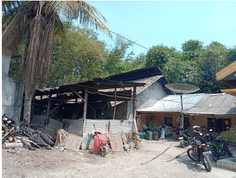
Gambar 3.3 Lokasi Pabrik Tahu