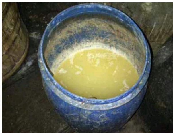
Gambar 3.4 Limbah Cair Tahu di tempat Penampungan sementara

Sampel limbah cair berasal dari industri tahu di Jl. Nawawi Al Haj, Lrg. Sejahtera 1, Rt/Rw. 003/001, Desa Tanjung Baru, Kec. Baturaja Timur, Kabupaten OKU. Pengambilan sampel dilakukan dengan cara mencuplik limbah dan dimasukkan ke dalam botol sampel berwarna gelap atau dilapisi alumunium voil. Pengambilan limbah cair dilakukan pada siang hari saat proses produksi berlangsung untuk titik sampel di pabrik tahu. Metode pengambilan sampel dilakukan dengan mengacu pada SNI 6989.59:2008 tentang air dan air limbah bagian 59: Metoda Pengambilan Contoh Air Limbah.