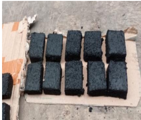
Gambar 3.6 Hasil Cetakan