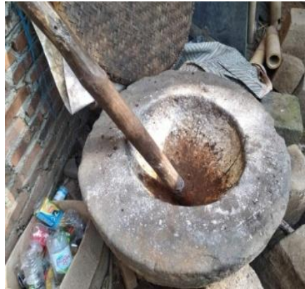
Gambar 3.3 lumpang dan alu