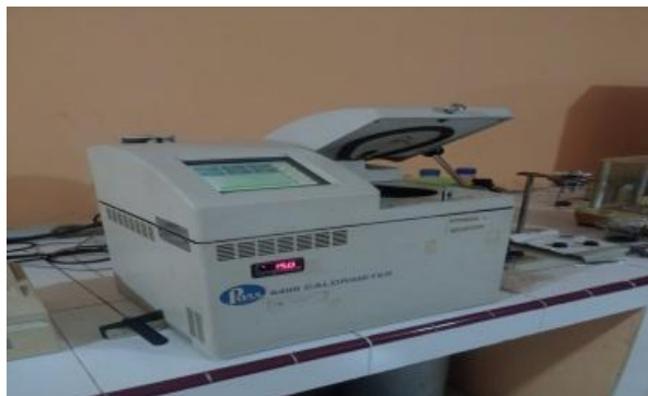
Gambar 3.7 Bom Kalorimeter

Pengujian Nilai Kalor : Untuk mengetahui kandungan energi dari briket, dilakukan pengujian nilai kalor menggunakan alat kalorimeter bom di Politeknik Negeri Sriwijaya.