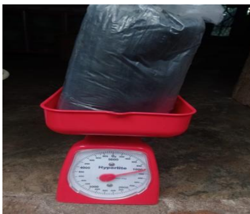
Gambar 3.5 Timbangan