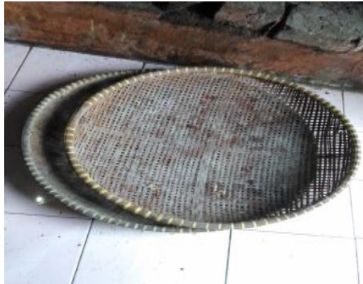
Gambar 3.4 Ayakan