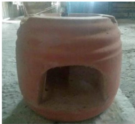
Gambar 3.2 Tungku geroboh

Proses Karbonisasi Cangkang sawit yang telah dibersihkan dimasukkan ke dalam tungku atau geroboh untuk proses karbonisasi. Proses ini dilakukan dalam kondisi terbatas oksigen untuk memastikan pembakaran tidak sempurna, sehingga menghasilkan arang bukan abu. Lama waktu karbonisasi bervariasi, umumnya memakan waktu 1–2 jam tergantung banyaknya bahan dan intensitas panas.