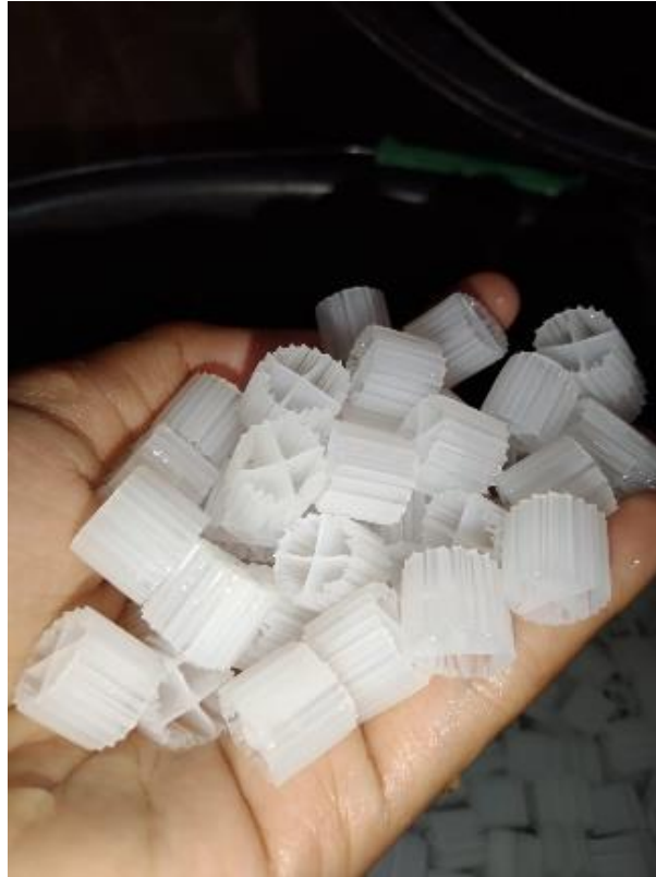
Gambar 2.3 Media Biofilm Kaldness 1 (K1)

menyediakan luas yang cukup besar untuk melekat bakteri (Ulfah Farahdiba dkk., 2019).