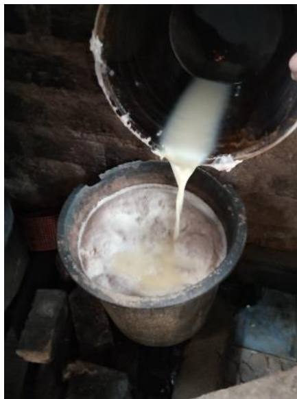
Gambar 2.1 Air Limbah Tempe

Setiap proses pengolahan produksi pasti akan menghasilkan limbah, termasuk dalam produksi tempe. Limbah produksi tempe termasuk ke dalam limbah jenis biodegradable , yang merupakan limbah hasil proses pengolahan yang dapat dihancurkan oleh mikroorganisme. Senyawa organik yang terdapat di dalam limbah produksi tempe akan dihancurkan oleh bakteri. Proses penghancuran tersebut berjalan lambat dan diiringi dengan bau busuk yang menyebar (Rajagukguk, 2020).