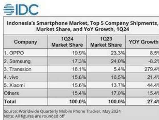
Tabel 1.1 Lima Besar Vendor Handphone Indonesia kuartal I-2024

dunia, termasuk Indonesia, dan berhasil menarik perhatian konsumen dengan produk-produknya yang inovatif. Dan pada saat ini OPPO adalah salah satu merk Handphone yang sedang naik daun di pasar seluler Indonesia. Seperti laporan yang dirilis oleh Firma riset pasar Interational Data Coporatiom (IDC) yang berisi 5 besar vendor Handphone dengan pangsa pasar terbesar di Indonesia untuk periode kuartal pertama (Januari-Maret) 2024. Pada kuartal I-2024 OPPO berhasil menguasai 19,9% pangsa pasar Handphone Indonesia, yang mengantarkan OPPO menjadi vendor Handphone no 1 di Indonesia.