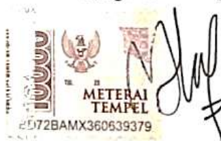
Meta Oliviyani NPM: 2111135