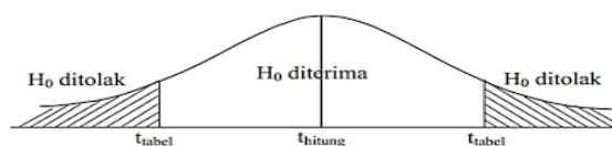
Gambar 3.1 Kurva Pengujian Hipotesis Parsial (Uji T)