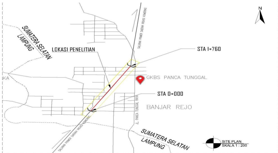
Gambar 3.2 Lokasi Penelitian