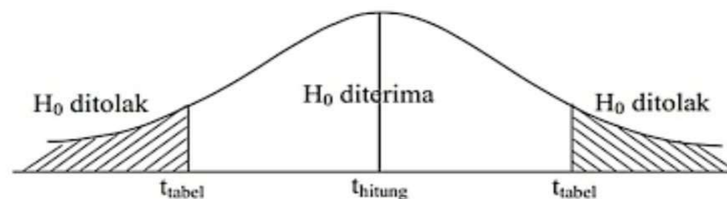
Gambar 3.2 Kurva Distribusi Uji t

Hasil dari t_{hitung} dibandingkan dengan t_{tabel} pada tingkat kepercayaan 95% dan taraf signifikan 5%.