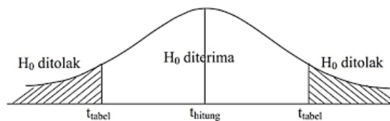
Gambar 3.1 Kurva Uji t

Jika t_{\text{hitung}} > t_{\text{tabel}} atau -t_{\text{hitung}} < -t_{\text{tabel}} , maka H_0 ditolak.