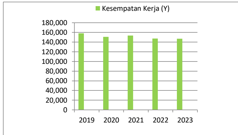
Gambar 1.3 Grafik Jumlah Kesempatan Kerja di Provinsi Sumatera Selatan Tahun 2019-2023