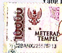
Gaya Safutri NPM: 2212005

Baturaja, Januari 2026 Yang membuat pernyataan,